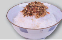
カネ吉の生ふりかけ 40g×2