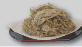
カネ吉のとろろ昆布 40g×1