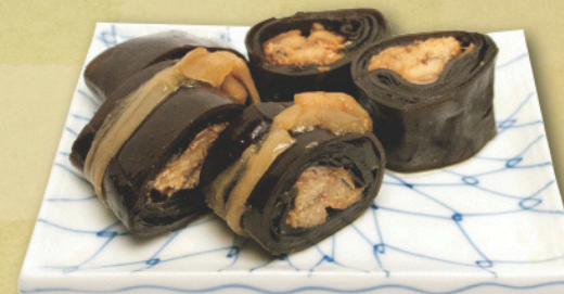
カネ吉の昆布巻(にしん) 約160g×2