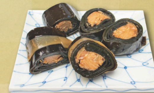
カネ吉の昆布巻(鮭) 約160g×2